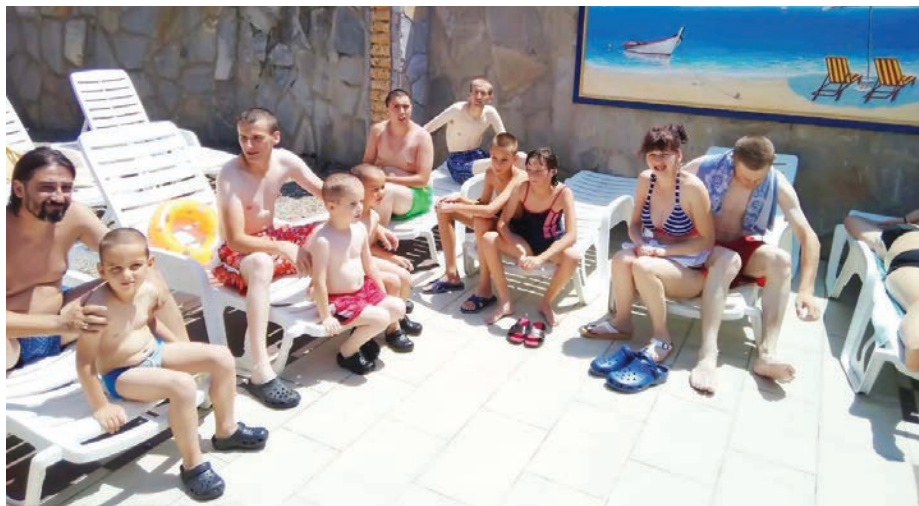
Корисници у посети Овчар Бањи

Деца из овог Дневног боравка 18. јула су била на излету на Златибору, у Луна парку и ресторану „Коноба”. Особље Луна парка је корисницима „Зрачка” поклонило жетоне за