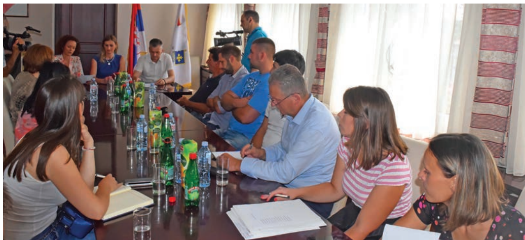
Детаљ са свечаности потписивања уговора о samozapošljavanju

„Чајетина детаљно анализира и прати стање на локалном тржишту и у складу са тим, уз сарадњу са НСЗ, реализује предвиђене програме у оквиру мера активне политике запошљавања. За програм samozapošljavanja био је пријављен већи број поднетих захтева у односу на планирани износ средстава. Општина Чајетина је уз стручну и техничку подршку НСЗ одобрила све поднете захтеве лица за samozapošljavanje.